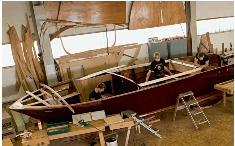
Ist so gross wie ein kleiner Garten, kostet so viel wie ein mittelgrosses Haus: ein Run-about von Pedrazzini in Bäch am Zürichsee, das von gelernten und angehenden Bootsbauern gefertigt wird. Allein der Beschlag am Bug – das Paradestück der Bootsbauerkunst – nimmt über 20 Arbeitsstunden in Anspruch (siehe Portrait Seite 46).